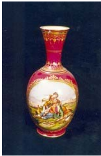
visina x promjer