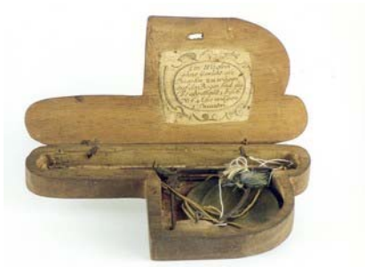
visina x širina x dubina dužina x promjer