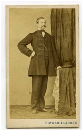
dužina x širina