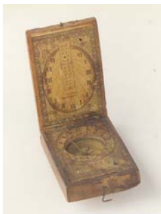
visina x širina x dubina