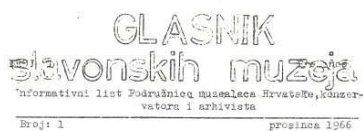
Slika 1. Prvi broj Glasnika slavonskih muzeja

Godine 1997. osniva se Muzejska udruga Istočne Hrvatske kao samostalno strukovno udruženje.