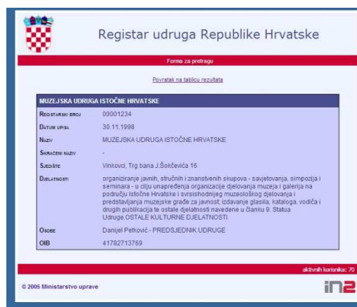
Slika 2. Upis MUIH-a u Registar udruga RH