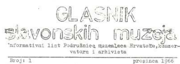
Slika 1. Prvi broj Glasnika slavonskih muzeja

Godine 1997. osniva se Muzejska udruga Istočne Hrvatske kao samostalno strukovno udruženje.