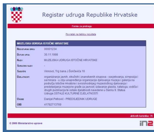
Slika 2. Upis MUIH-a u Registar udruga RH