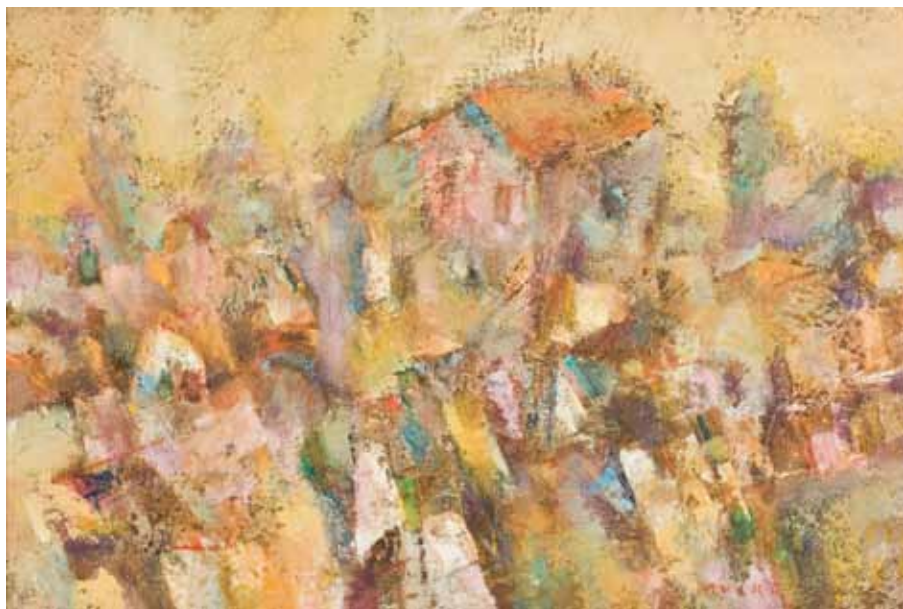
KUĆE Kopřivnice, 2008. ulje na platnu 330 x 510 mm