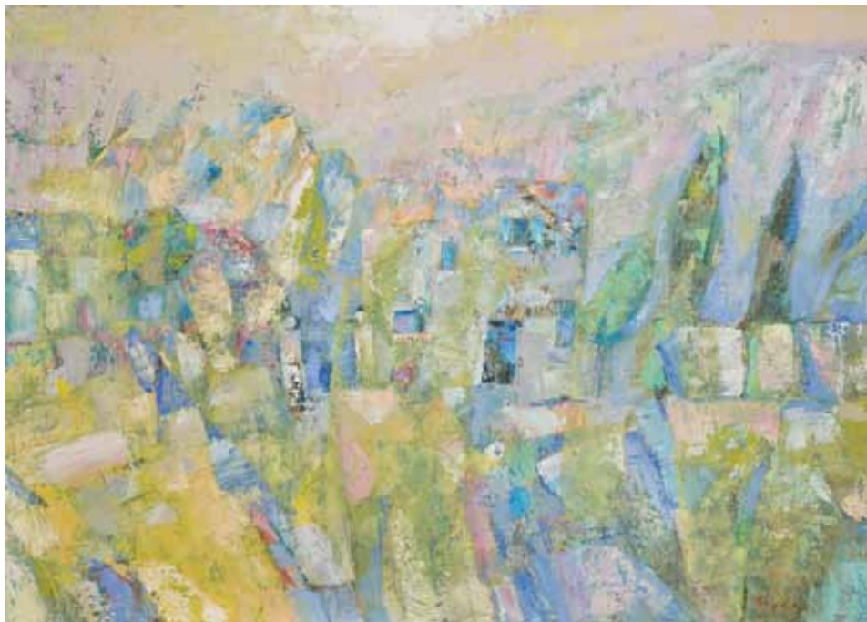
KUĆE Koprivnica, 2010. ulje na platnu 800 x 1000 mm