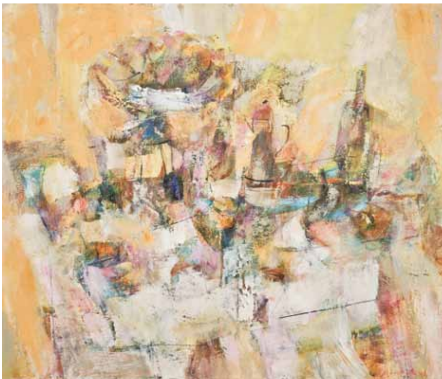
MRTVA PRIRODA Koprivnica, 2010. ulje na platnu 400 x 600 mm