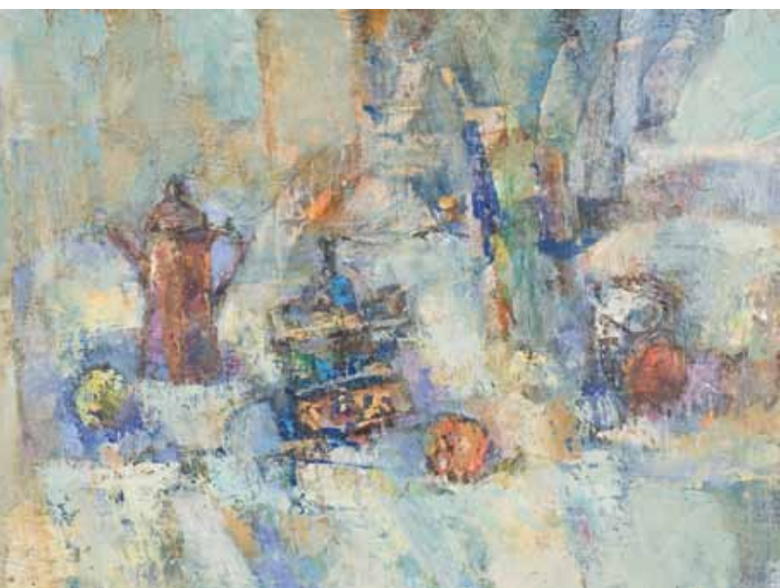
MRTVA PRIRODA Koprivnica, 2008. ulje na platnu 500 x 700 mm