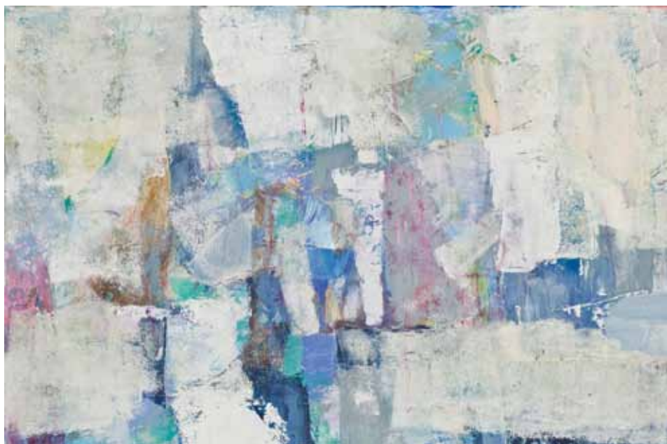
KOMPOZICIJA Koprivnica, 2010. ulje na platnu 400 x 600 mm