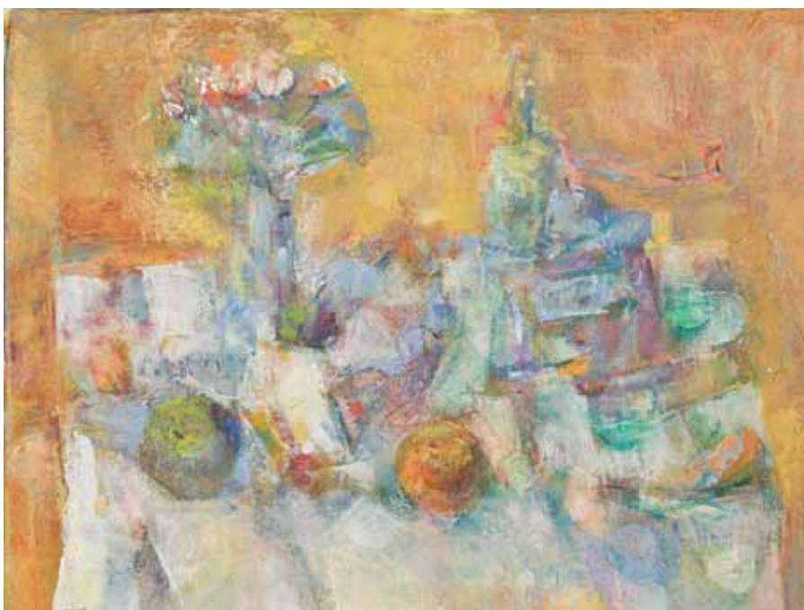
MRTVA PRIRODA Koprivnica, 2010. ulje na platnu 350 x 450 mm