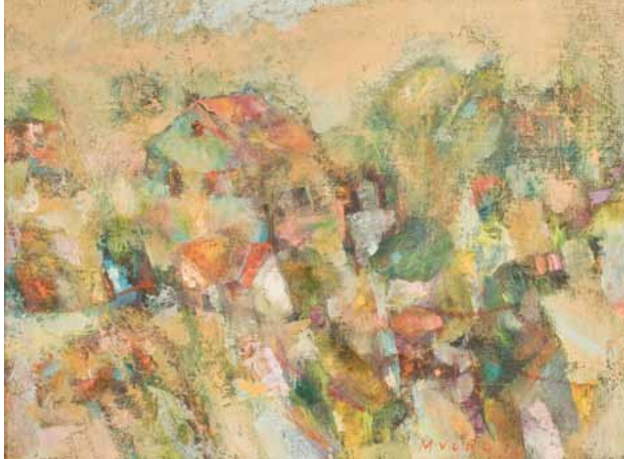
KUĆE Kopřivnice, 2008. ulje na platnu 300 x 400 mm