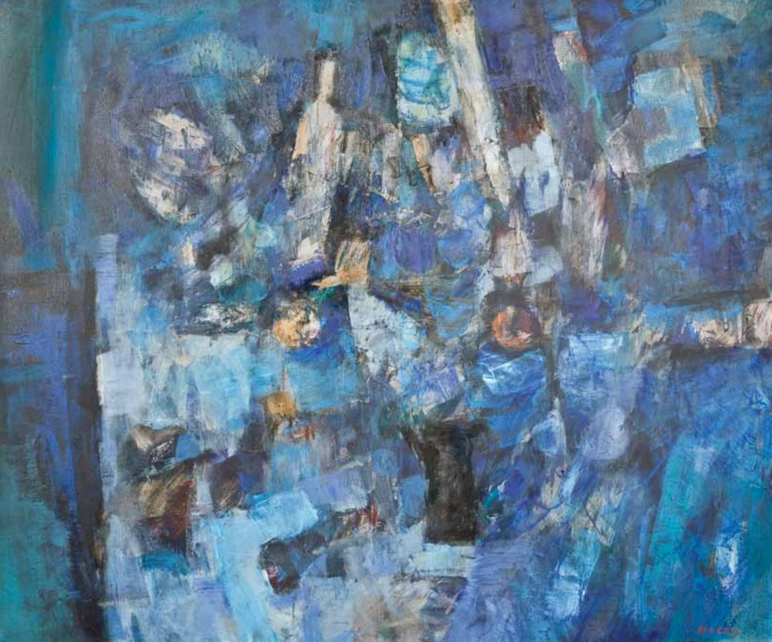
MRTVA PRIRODA Koprivnica, 2007. ulje na platnu 1000 x 1200 mm