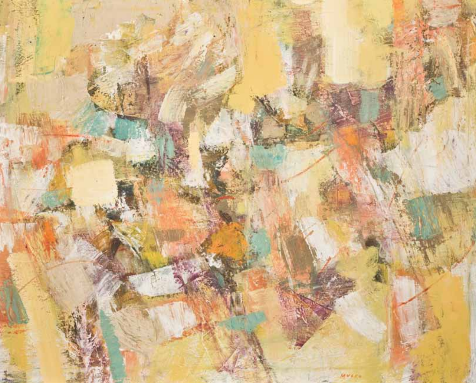
MRTVA PRIRODA Koprivnica, 2008. ulje na platnu 800 x 1000 mm