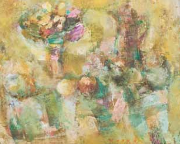
MRTVA PRIRODA Koprivnica, 2008. ulje na platnu 280 x 340 mm