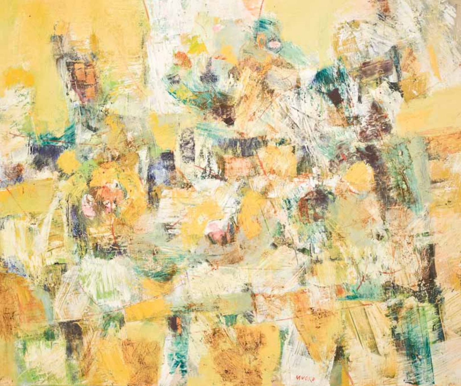
MRTVA PRIRODA Koprivnica, 2008. ulje na platnu 1000 x 1200 mm