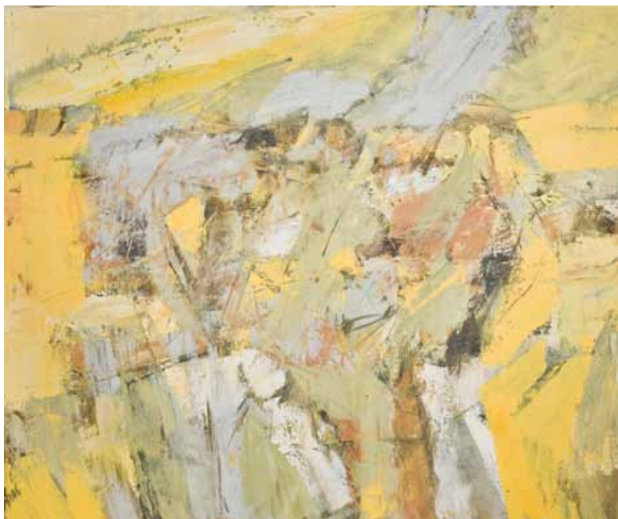
KRAJOLIK Kopřivnice, 2010. ulje na platnu 1000 x 1200 mm