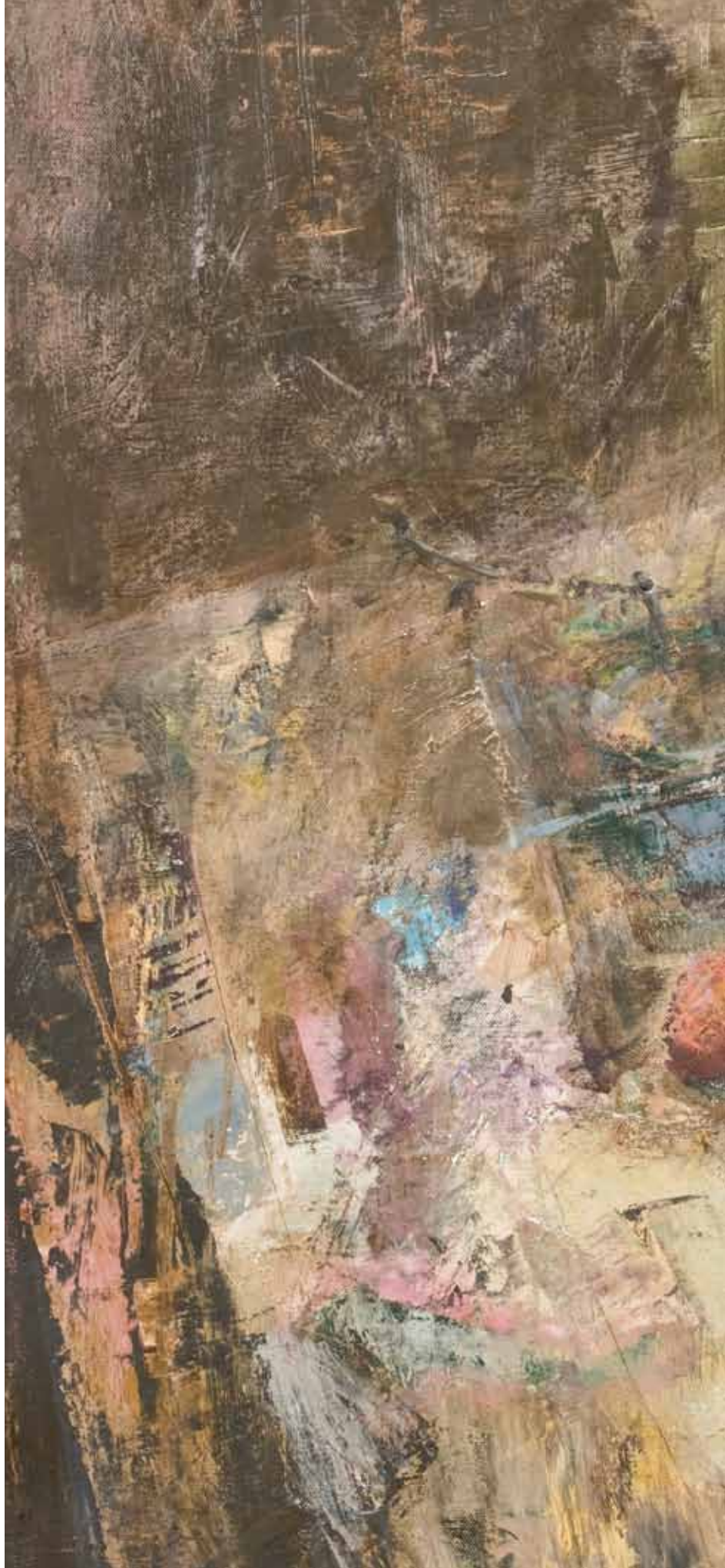
MRTVA PRIRODA Koprivnica, 2007. ulje na platnu 700 x 900 mm