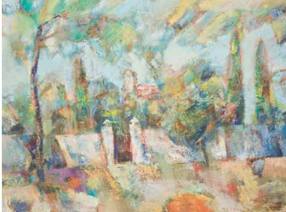
ŠOLTA Koprivnica, 2008. ulje na platnu 750 x 1000 mm