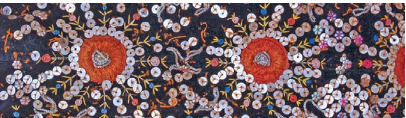
Detalji oglavlja kapice

Baranjska nošnja načelno nosi karakteristike panonskoga etnografskog područja te je kao i sve nošnje istočnoga nizinskog dijela Hrvatske prepoznatljiva po primarnoj i obilnoj upotrebi platna biljnoga podrijetla u izradi ruha, te po svojem bogatstvu ručnog rada u vezu i tkanju, skladnih boja i motiva.